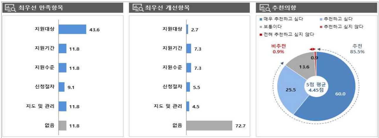
[그림 1] 장애인고용관리지원 만족/개선 항목 및 추천 의향

주: 1) 만족항목 - 전체: 지원대상(28.8) > 지도수준(16.9) > 지도/관리(10.3) > 지원기간(9.8) > 신청절차(9.1) ; 없음(25.1) - 안정: 지원대상(39.5) > 지원수준(19.8) > 지도/관리(9.8) > 신청절차(9.0) > 지원기간(8.5) ; 없음(13.4) 2) 개선항목 - 전체: 신청절차(8.6) > 지원기간(5.9) > 지원수준(4.8) > 지원대상(3.7) > 지도/관리(3.1) ; 없음(74.0) - 안정: 지원기간(10.8) > 지원수준(7.1) > 신청절차(6.1) > 지도/관리(4.5) > 지원대상(3.1) ; 없음(68.3) 3) 추천 의향 - 전체: 4.29점, 추천(81.9=31.4+50.5) > 보통(15.4) > 비추천(2.7=2.1+0.6) - 안정: 4.33점, 추천(84.0=32.5+51.4) > 보통(13.8) > 비추천(2.2=2.1+0.1)